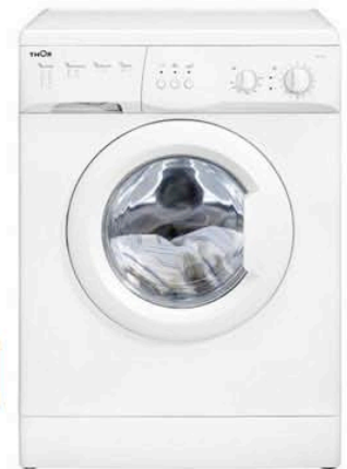
Lavadora 500 r.p.m 15 programas