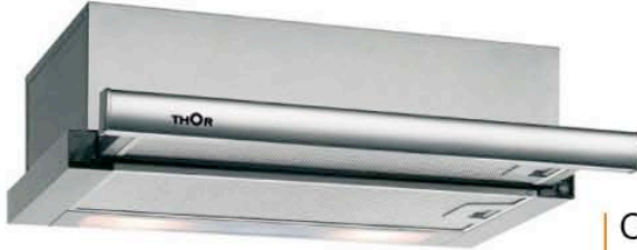
Campana extraíble 2 velocidades