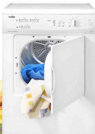
Secadora 6kg de carga 8 programas