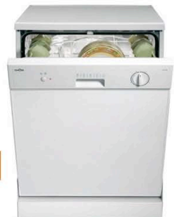
Lavavajillas 60cm 5 programas lavado